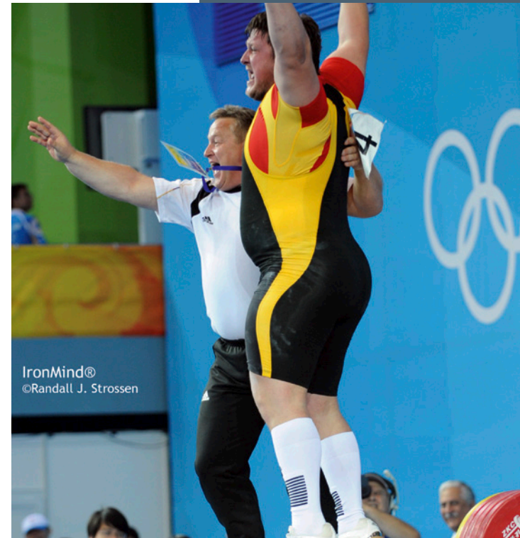
IronMind® ©Randall J. Strossen